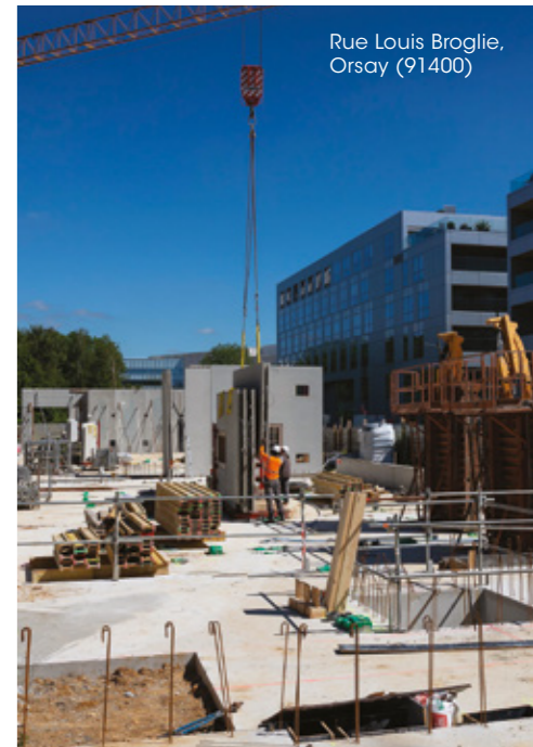
Rue Louis Broglie, Orsay (91400)

48 M€ de travaux d'amélioration et de réhabilitation réalisés sur la patrimoine 60 gardiens et responsables de sites formés à l'application ALI TRANQUIL