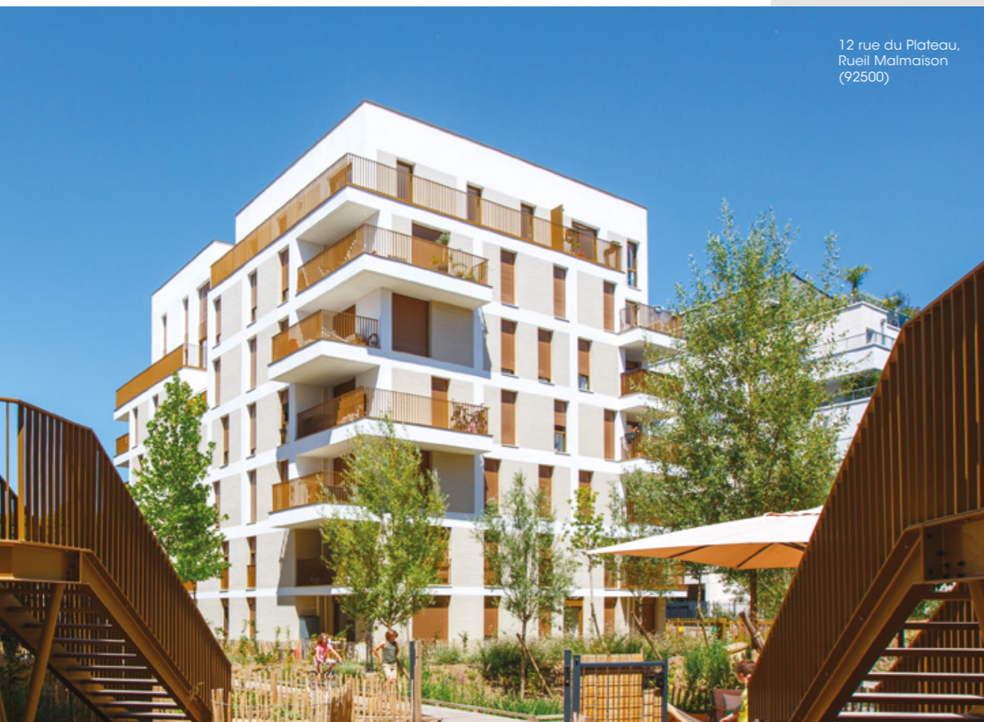
12 rue du Plateau, Rueil Malmaison (92500)

05 Garantir l'éthique des pratiques et animer une gouvernance d'entreprise responsable