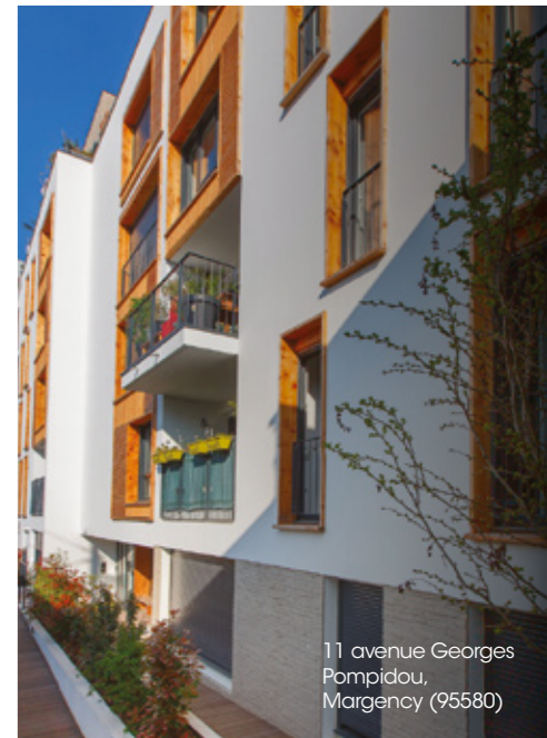
11 avenue Georges Pompidou, Margency (95580)

3 221 € de gain annuel moyen de pouvoir d'achat par ménage 97% de nouveaux entrants appartenant à la classe moyenne 6 82% des nouveaux locataires ont moins de 40 ans