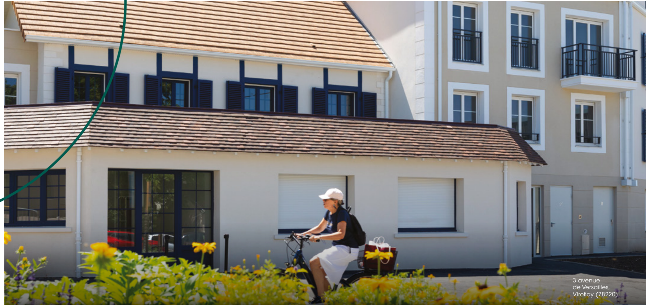
3 avenue de Versailles, Viroflay (78220)

CONSCIENTS DES GRANDS DÉFIS ENVIRONNEMENTAUX ET DE SOCIÉTÉ ET DE LA NÉCESSITÉ D'Y APPORTER DES RÉPONSES À LA HAUTEUR DES ENJEUX, NOUS AVONS PLACÉ NOTRE DÉMARCHE RSE AU CŒUR DE NOTRE PLAN STRATÉGIQUE ET DE NOTRE GOUVERNANCE