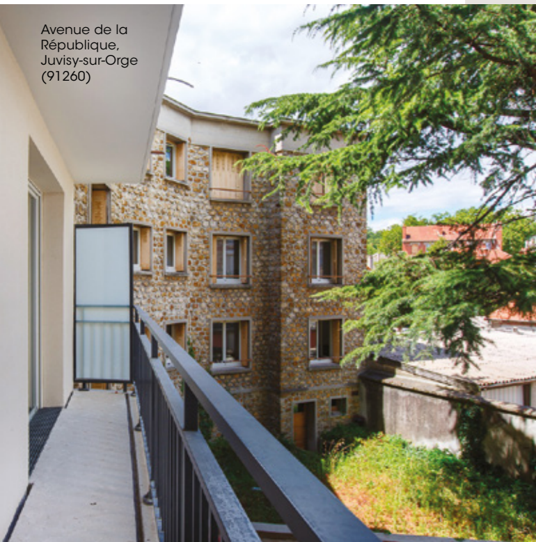
Avenue de la République, Juvisy-sur-Orge (91260)

Le secteur du bâtiment représente 44% de la consommation énergétique finale et plus d'un tiers des émissions de gaz à effet de serre en France 11 . Parce qu'il faudrait rénover 500 000 logements par an pour atteindre l'objectif de neutralité carbone de la France à horizon 2050, nous avons un rôle majeur à jouer dans la rénovation énergétique et la construction de logements neufs très performants.