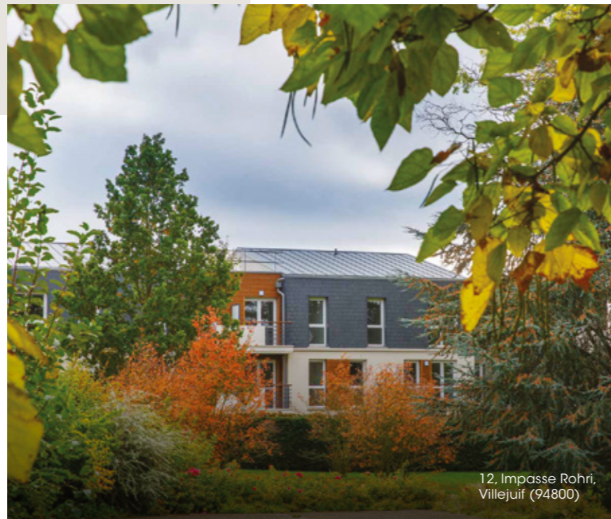
12, Impasse Rohri, Villejuif (94800)

Dans un contexte économique marqué par un retour de l'inflation et une hausse continue des prix de l'immobilier dans la région francilienne, notre objectif est de permettre aux salariés des classes moyennes d'accéder à des logements abordables et de contribuer à la mixité sociale de nos territoires d'implantation.